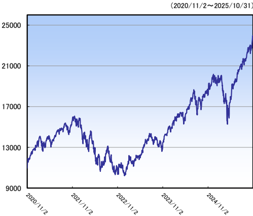
ナスダック総合指数