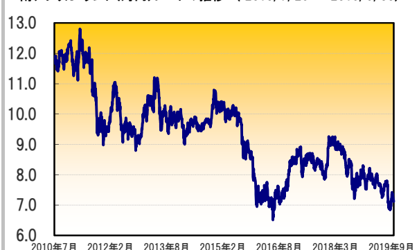
南アフリカ・ランド(対円)レートの推移 (2010/7/29～2019/9/30)

出所：ブルームバーグのデータをもとにキャピタルアセットマネジメントが加工して作成