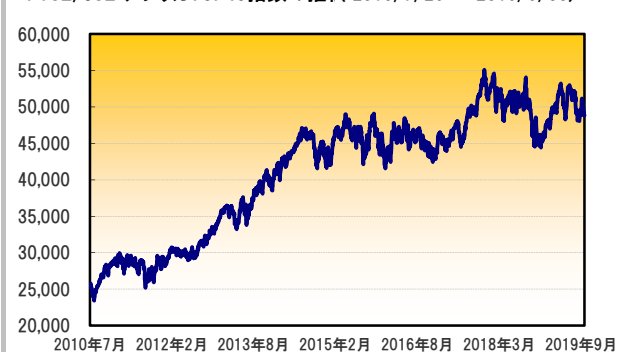
FTSE/JSE アフリカTOP40指数の推移 (2010/7/29～2019/9/30)