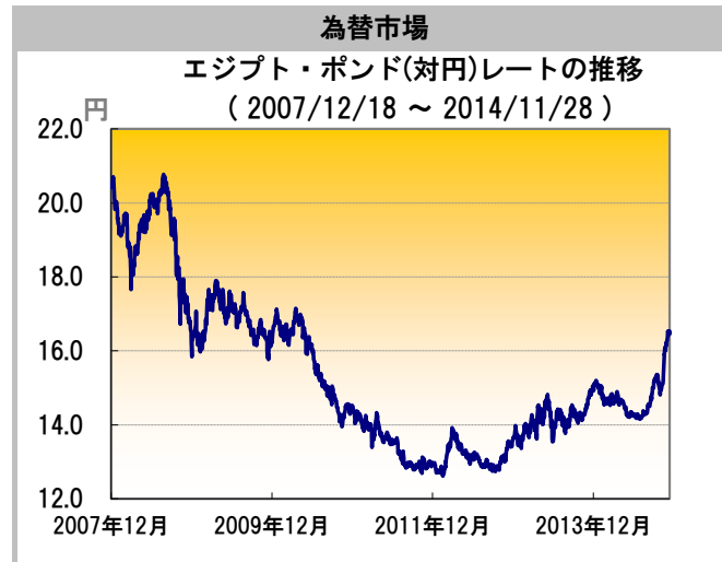
データ：投資信託協会